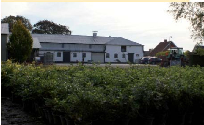
Planteskolen i Nordrup har specialiseret sig i produktion af frugtræer og buske.