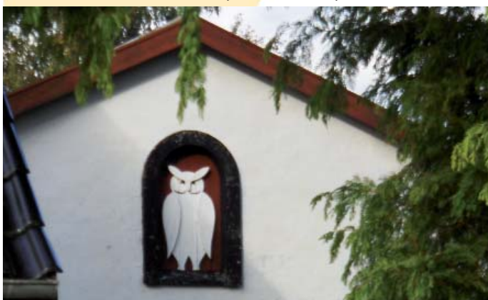
Ugle placeret på gavlen af en landejendom bygget af en lokal tømrermester. (Foto: Elisabeth Ejlekær Nielsen).