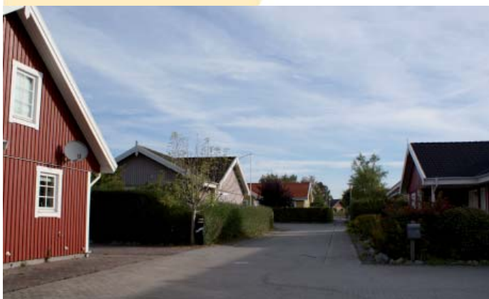
Den nye udstykning 'Bulderby' ved Jens Hansensvej, består af svenske træhuse.