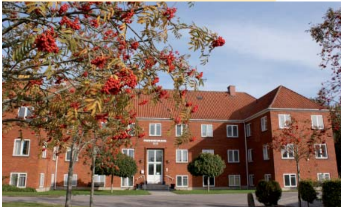
I huset Rønnevang er der i dag ældreboliger.