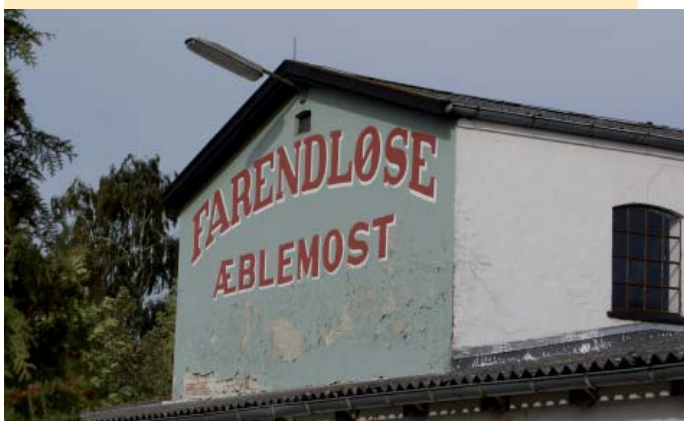
I Farendløse blev der tidligere produceret æblemost på mosteriet.