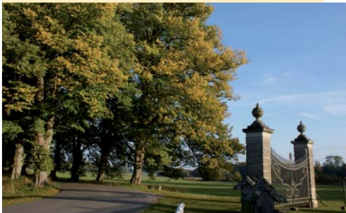
Giesegaard gods ligger i den østlige del af området.