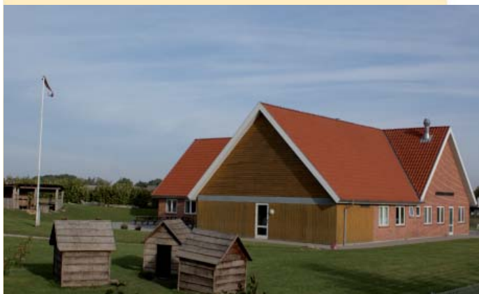
Nordrup Børnehus er nabo til Nordbakkeskolen.