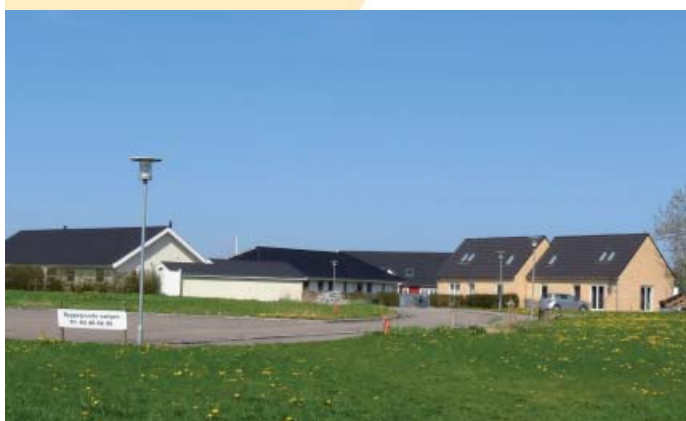
Der er ledige grunde ved Stavskovvej.