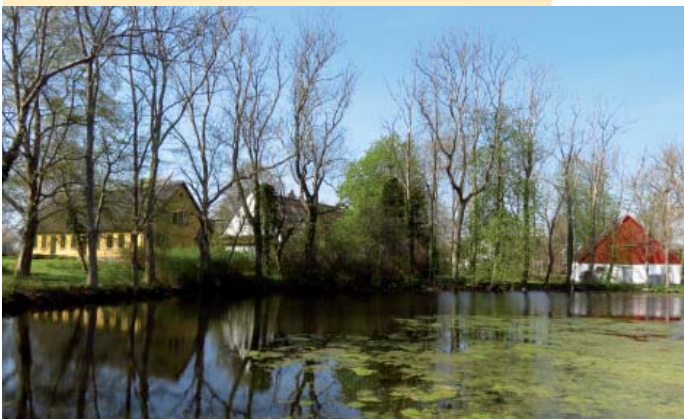
Gadekæret i Kagstrup er byens oprindelige branddam.