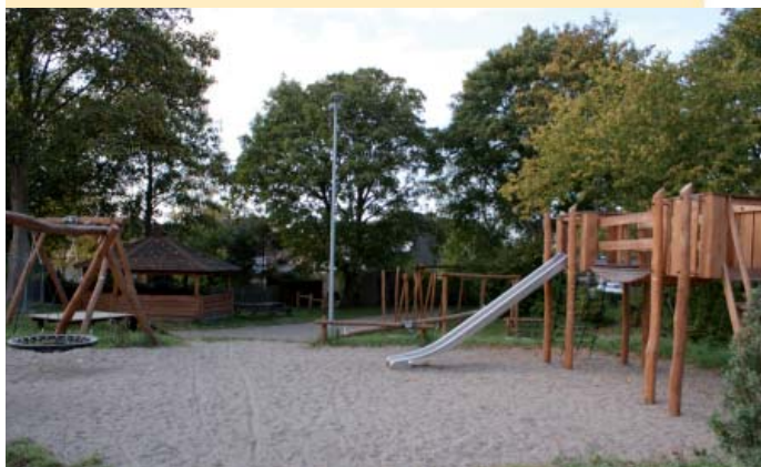
Ørslev Fritidspark er etableret på initiativ af en borgergruppe og støttet af LAG.