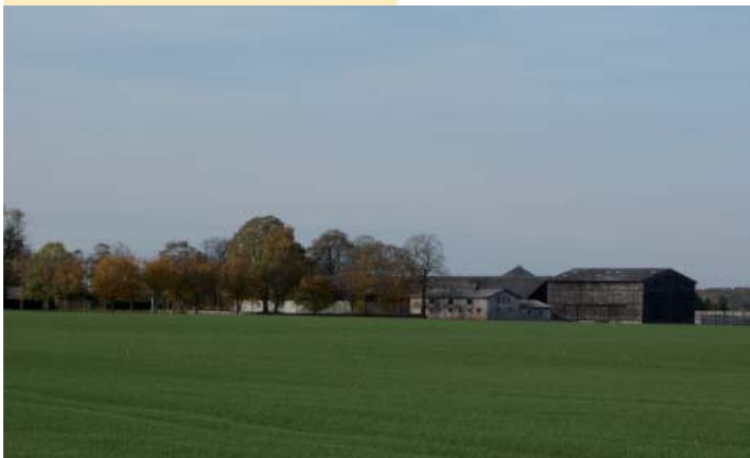
Ottestrupgård har været avlsgård under Giesegaard.