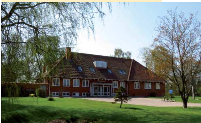
I Kastaniely er der 8 beskyttede ældreboliger.