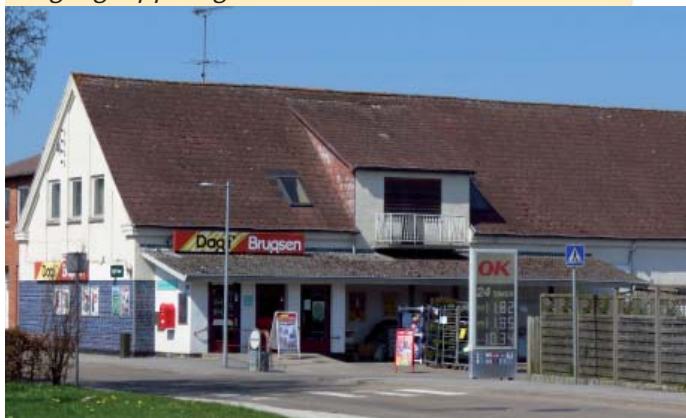
Indkøbsmulighed er Dagli'Brugsen i Ørslev. Ørslev Brugs blev grundlagt i 1907.