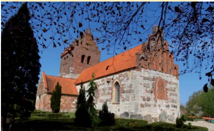
Ørslev kirke er fra ca. 1180, bygget af faksekalksten. Kirken har hørt under Giesegaard.